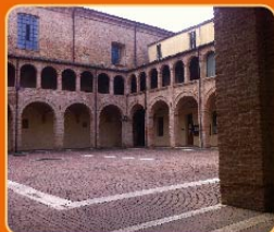
Chiostro di San Domenico (XIII secolo) sede della manifestazione